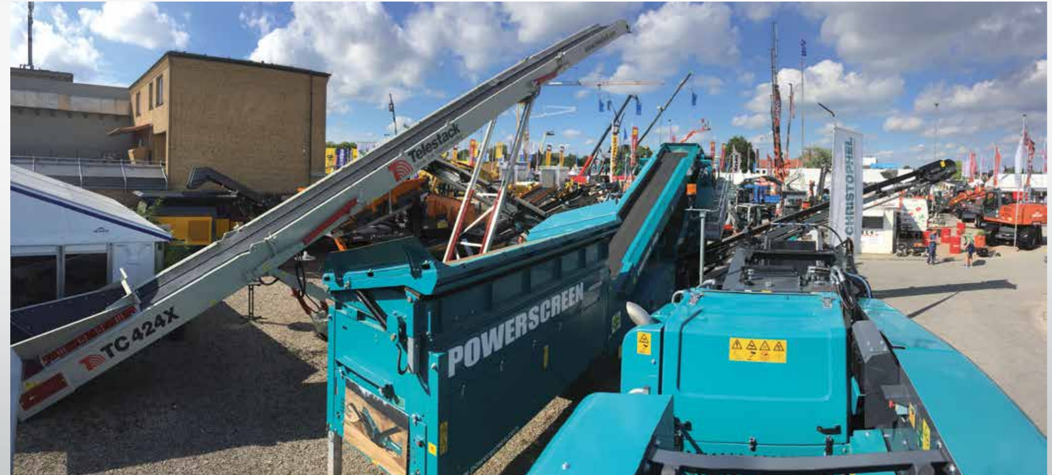
Foto: Blick auf den Messestand auf der NordBAU 2018

noch die Luftmenge reguliert, werden Leicht- und Schwerstoffe getrennt. Alle Einstellungen können ohne Werkzeug von einer zentralen Stelle aus vorgenommen werden. Der AirMaster Neo wird extern oder durch das eigene Stromaggregat betrieben.