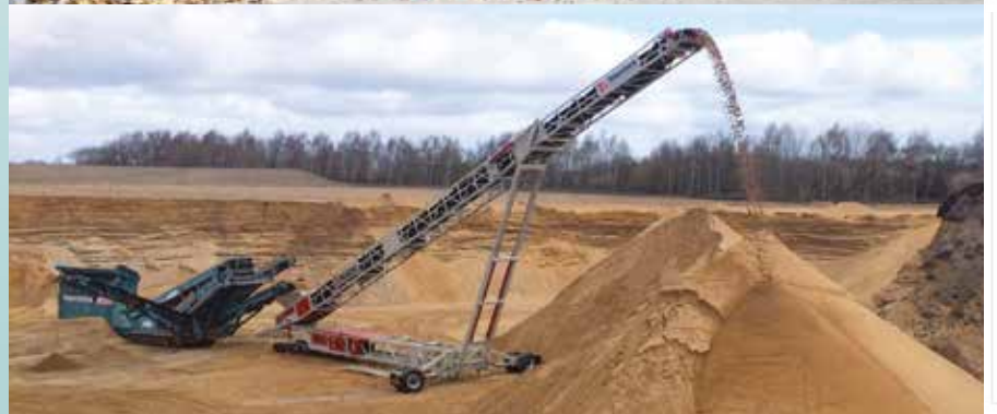
HALDEN & UMSCHLAGEN